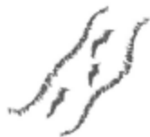
信濃川 信濃川 SHINANO RIVER

Show the sound of water by drawing lines.